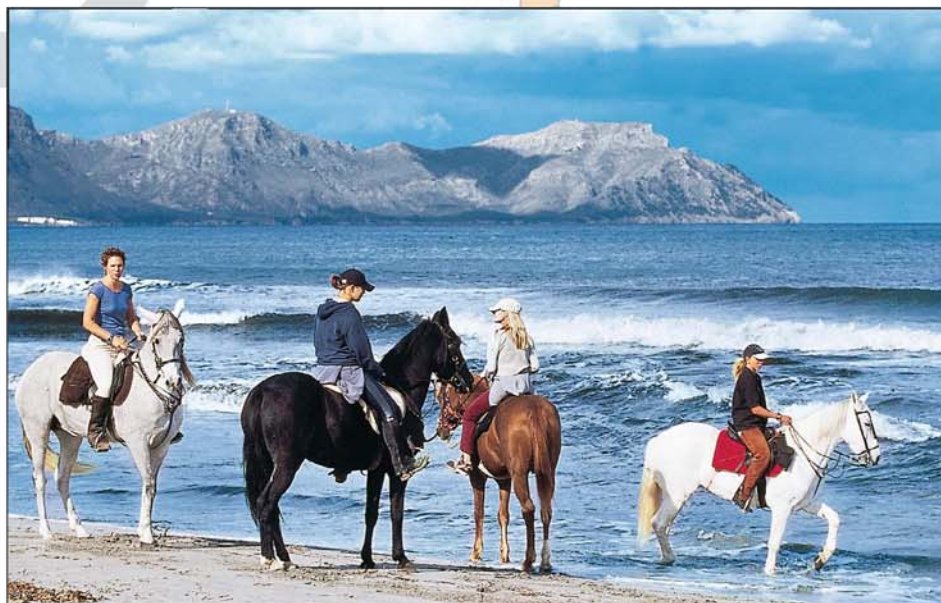
Glücksmomente: morgendlicher Ausritt an die Playa de Muro (l.), ausgedehntes Frühstück auf der Terrasse der Finca (Bild rechts)

dem 18. Jahrhundert stammen, und machte ein Restaurant daraus. 1984 errichtete er ringsum im Bungalowstil 15 Gästezimmer mit Terrassen, die im Jahr 2000 vollständig renoviert und mit Zentralheizung und Aircondition ausgestattet wurden. Wer nicht in der einzigen Suite wohnt, muss zum Fernsehen allerdings ins Haupthaus gehen. Auch den Anschluss für den Laptop sucht man im Zimmer vergebens. Nach Son Serra kommt man eben nicht zum Arbeiten, sondern zum stressfreien Ausspannen. Frühaufstehern bietet sich die Möglichkeit, Ausritte an den Strand zu unternehmen, solange der nicht von Badegästen bevölkert ist. Frühstücken kann man dann auf der Finca noch in aller Ruhe bis 12 Uhr mittags. Wenn sich mindestens sechs Interessenten finden, die jeweils 70